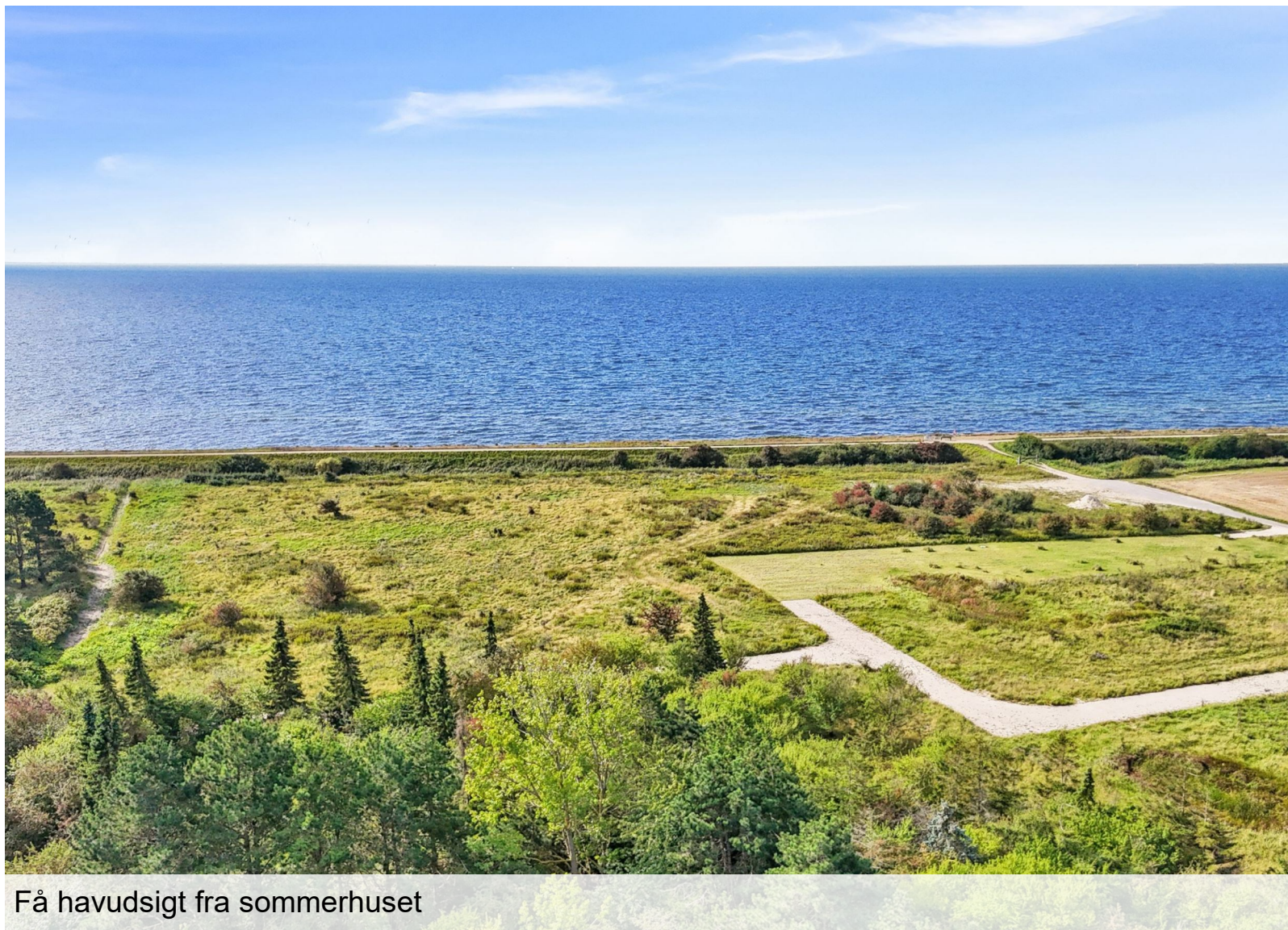
Få havudsigt fra sommerhuset